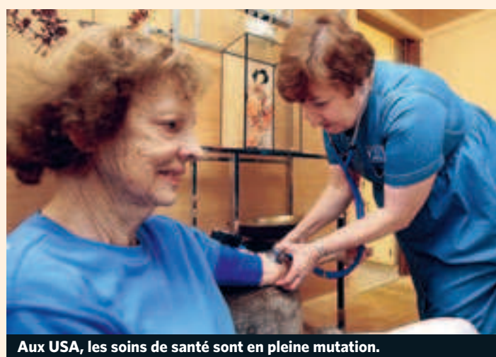
Aux USA, les soins de santé sont en pleine mutation.